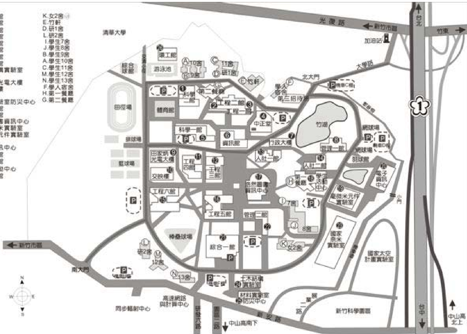
國立交通大學光復校區地圖

National Chiao Tung University Kuang-Fu Campus